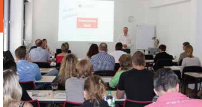
Ein Element des dualen Studiums: Kompakte Präsenzphasen