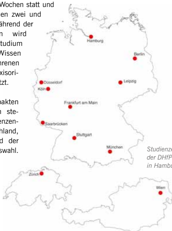
Studienzentrum der DHfPG, u.a. auch in Hamburg

Für die kompakten Präsenzphasen stehen elf Studienzentren in Deutschland, Österreich und der Schweiz zur Auswahl.