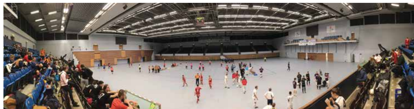
Panoramablick in die Sporthalle Hamburg