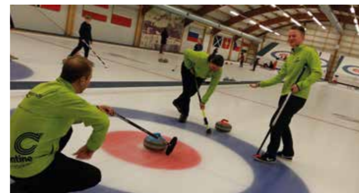
Curling boomt – Sportler in Aktion auf dem Eis (Halle in der Hagenbekstraße 124)