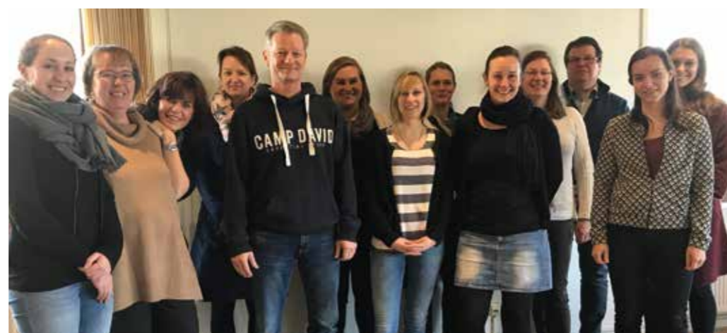
Die Gruppe der hauptamtlichen Mitarbeitern aus den BSGen