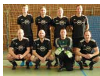
Wasser und Verkehrskontor