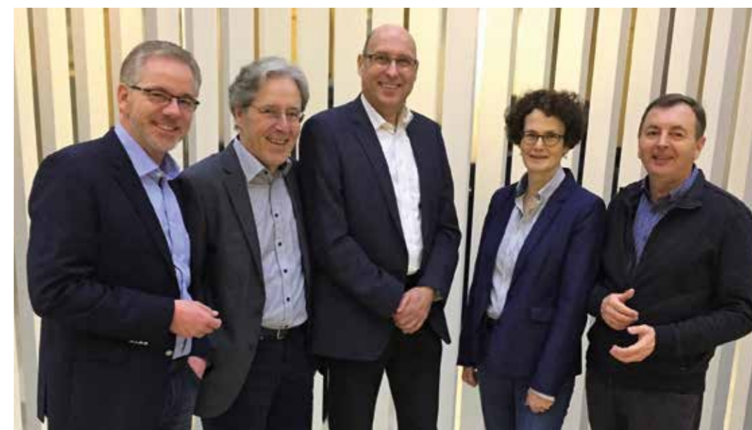
Mitglieder der Wirtschafts-Senioren Hamburg in der Handelskammer Hamburg

Donnerstag: Mitgliedersitzung der Wirtschafts-Senioren – hier werden die neuen Beratungsaufträge verteilt! Die Sitzung lässt sich – nach einer Fahrt mit der S-Bahn – auch mit einem Spaziergang verbinden.