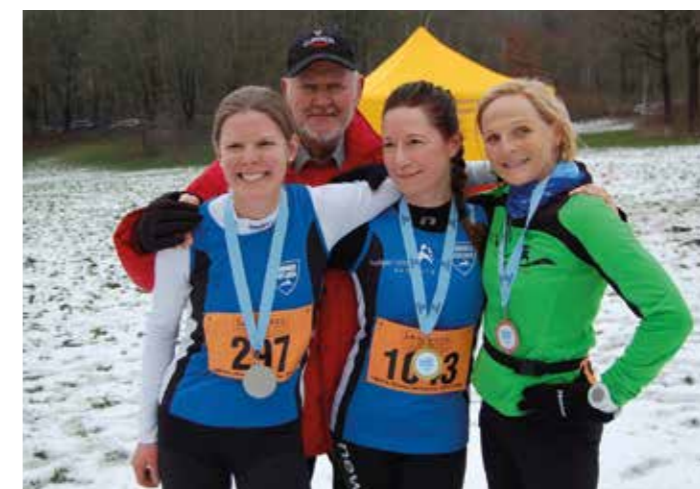
Orlo mit den Siegerinnen der Langstrecke

ten Damen und Männer der Gesamtwertungen, so auch bei