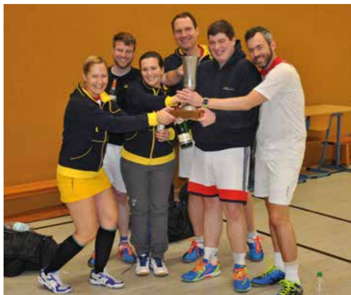
Die Siegermannschaften bei der Pokalübergabe