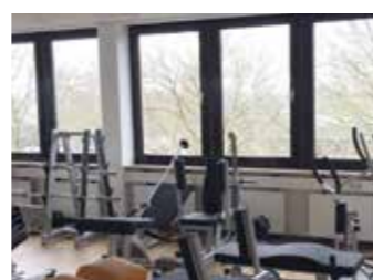
Praxisraum für praktische Unterrichtseinheiten am Studienzentrum Hamburg