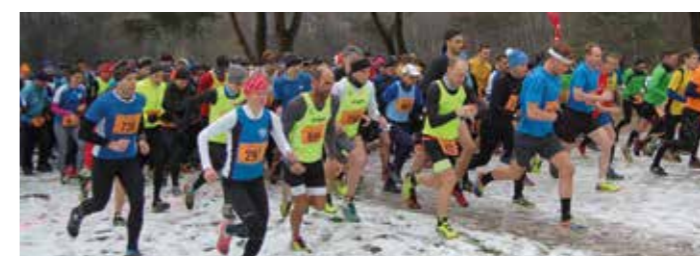
Start der Langstrecke

Wenige Minuten nach dem Zieldurchlauf erfolgen stets die Siegerehrungen für die drei schnell-