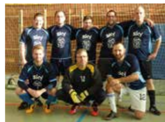
Team Kähler und Konsorten